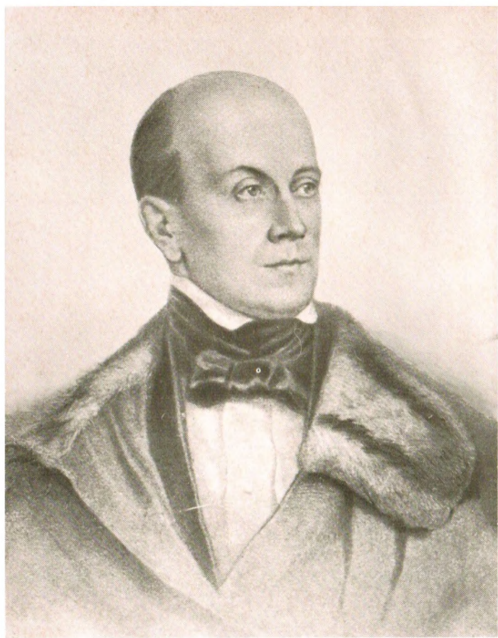
ПЕТРЪ ЯКОВЛЕВИЧЪ ЧАДАДЕВЪ